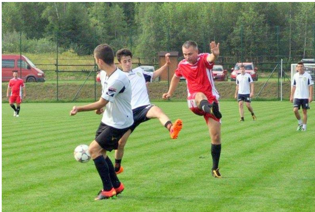
Futbalový zápas na ihrisku v Bacúchu