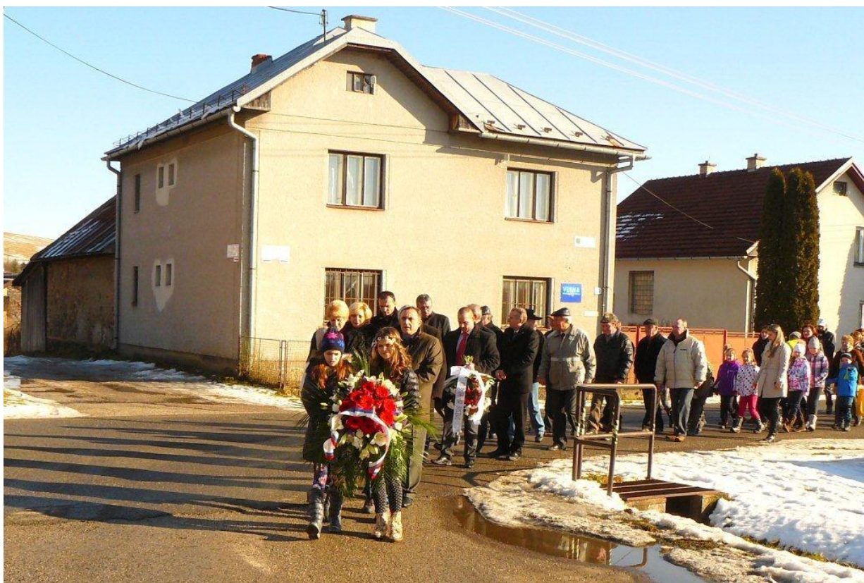
Kladienie vencov pri príležitosti oslobodenia obce