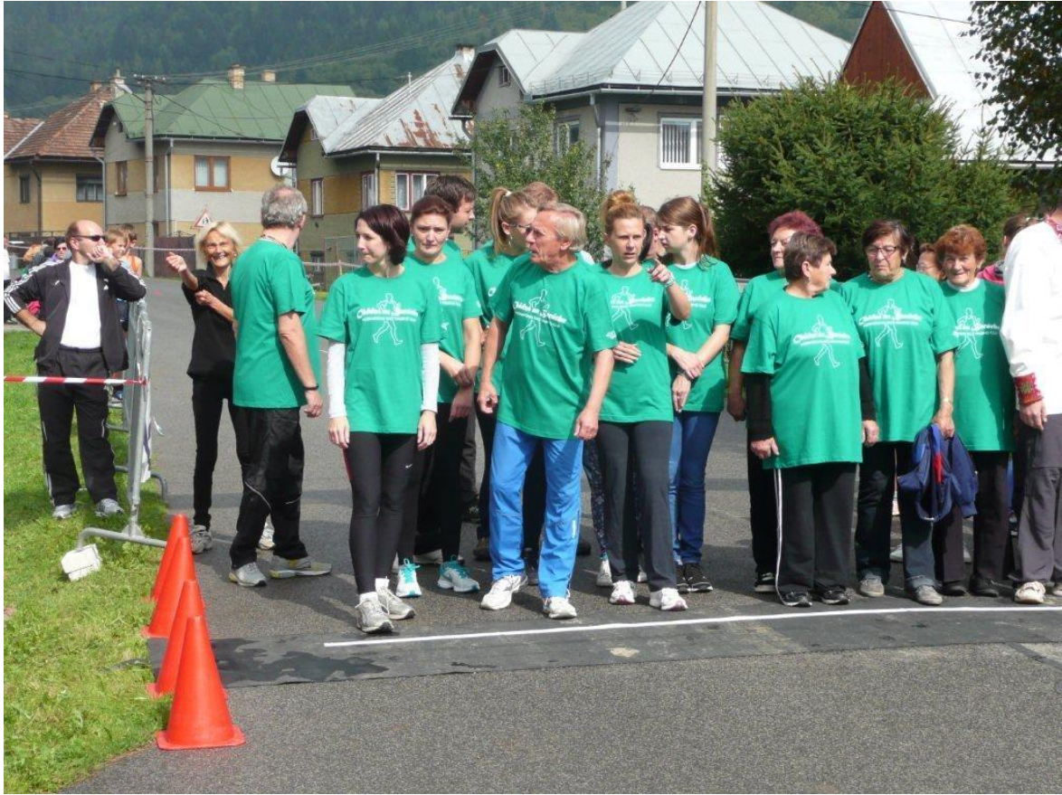
Chôdza pre zdravie – odštartovanie chodeckých pretekov