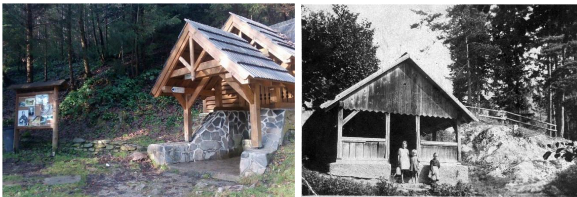
Prameň Boženy Němcovej v jeho súčasnej a historickej podobe