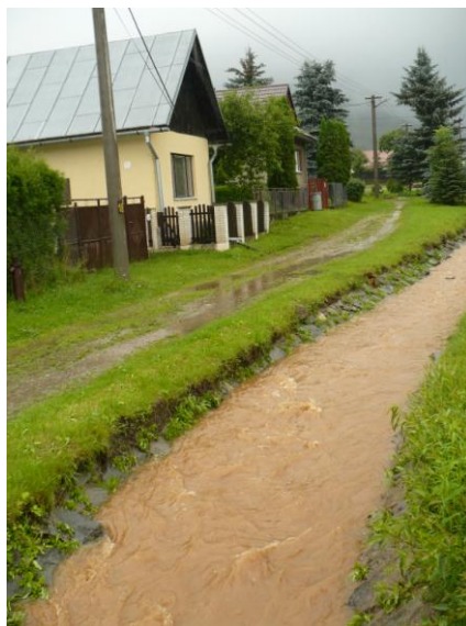
Potok Čerchľa pred a po vyčistení